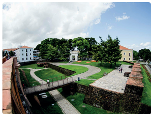
FORTE DO PRESÉPIO

Popularmente conhecido como Forte do Castelo, foi com a construção dessa fortificação que a cidade começou a se estabelecer. Vale entrar para conferir o museu e ter uma das vistas mais bonitas da Cidade Velha e do Rio Guamá.