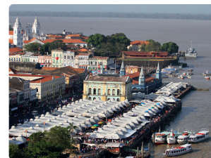
PASSEIO DE BARCO PELA ORLA DE BELÉM

Uma visão privilegiada da cidade em passeio pela Baía do Guajará e Rio Guamá. Contemplando Belém através do rio em um de seus mais belos ângulos: Ver-o-Peso, Forte do Presépio, Casa das Onze Janelas, Cidade Velha, Porto do Sal e Estação das Docas.