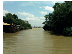
ILHA DO COMBU

Fica a cerca de 15 minutos de barco da capital do estado. A ilha é a mais próxima de Belém e é muito conhecida pela produção de açaí e cacau. Para chegar até à ilha é necessário fazer o embarque na Praça Princesa Isabel, no bairro da Condor. A ilha ainda conta com diversos restaurantes e com a fábrica de chocolate da Dona Nena.