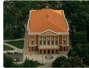
THEATRO DA PAZ

Belém é uma das maiores cidades da Região Norte, com 1,5 milhão de habitantes. Fundada em 1616, a cidade surgiu pela importância estratégica com a construção do Forte do Presépio na margem da Baía do Guajará , e cresceu graças à economia da borracha durante o período da Belle Époque , cuja influência pode ser percebida na arquitetura dos prédios que compõem o centro histórico . Atualmente, conhecida como Cidade das Mangueiras , a capital desponta como grande roteiro turístico do Brasil, sendo a segunda cidade mais visitada da Amazônia . Em Belém, o turista encontra diferentes possibilidades de diversão, seja em eventos religiosos, culturais ou gastronômicos .