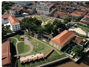
COMPLEXO FELIZ LUSITÂNIA

O complexo contempla a Catedral Metropolitana de Belém, praça Dom Frei Caetano, Casa das Onze Janelas, Corveta Museu Solimões, Forte do Presépio e o complexo de Santo Alexandre. Onde encontra-se a Igreja e o Museu de Arte Sacra do Pará.