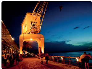
ESTAÇÃO DAS DOCAS

Trata-se de um moderno complexo turístico e gastronômico, composto por restaurantes, bares, sorveterias, lojas, cinema, museu e um terminal fluvial. Assim é o visual da orla do antigo porto de Belém, transformado em polo de entretenimento.