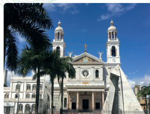
BASÍLICA SANTUÁRIO DE NOSSA SENHORA DE NAZARÉ