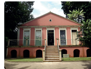
MUSEU EMÍLIO GOELDI

Numa área de cinco mil metros quadrados de frente para a Baía do Guajará, o local proporciona a apreciação da natureza, com comidas típicas, shows musicais, cultura além de uma exuberante paisagem.