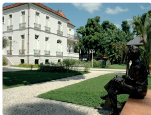
PARQUE DA RESIDÊNCIA

É conhecido por ter sido a residência oficial dos governadores do estado a partir de 1934. Teve como primeiro morador Magalhães Barata. O ambiente oferece ao visitante uma paisagem agradável além de sorveteria, museu, teatro e restaurante.