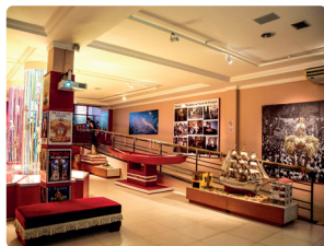
MUSEU DO CÍRIO

O Museu do Círio integra o Complexo Feliz Lusitânia, no bairro da Cidade Velha. Retrata a história da devoção popular em torno da celebração do Círio de Nossa Senhora de Nazaré, maior manifestação religiosa do Estado do Pará. O acervo contempla as vertentes históricas, culturais e artísticas através de aproximadamente 2.000 peças.