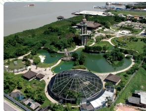
MANGAL DAS GARÇAS

Localizado às margens do rio Guamá, em pleno centro histórico, o parque é uma área de 40.000 m2 composto por um mirante de 47 metros de altura, viveiro de pássaros, borboletário, loja de plantas e restaurante.